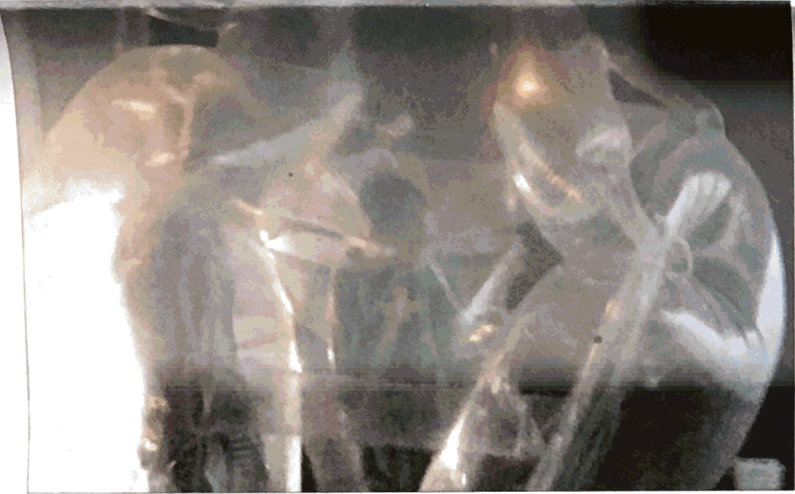
■ De 'inflatable meeting room': een bewegende kunstmatige ruimte vol spanning en emotie.