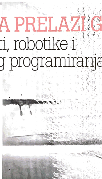
Hrvatsku predstavlja "Oblak Pergola/Arhitektura gostoljubivosti"