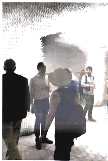
Autori hrvatskog paviljona ističu fantastičan prijem publike i struke

Moje je mišljenje da je arhitektura jedna vrsta "društvene skulpture" čija je definicija šira od samog pi-tanja suradnje i autorstva. Tome svjedoče i nastajanje ovog paviljona. Da bi realizirali "Oblak Pergolu" morao sam spojiti institucije kao što je Ministarstvo, tehnološki start-up iz Londona koji je 3D printao strukturu "Pergole", velika korporativna inženjerska studija iz Londona, kao i sve sudionike involvirane u proces stvaranja. Upravo finalni rezultat ukazuje na to da se kultura i može i mora savijati s