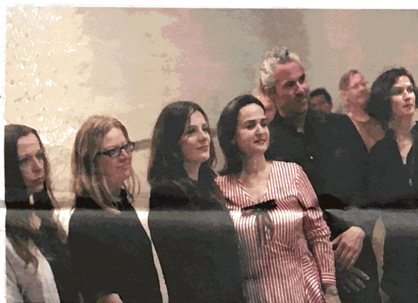
Autorski tim na otvaranju hrvatskog paviljona